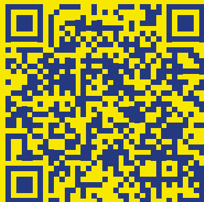
Stranica o predmetu

Za više informacija skenirajte kodove ispod sa kamerom vašeg telefona: